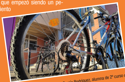
Fotografía realizada por Alicia García Rodríguez, alumna de 2º curso del ciclo de Asistencia a la Dirección

Puedes venir a visitar la exposición en cualquier momento.