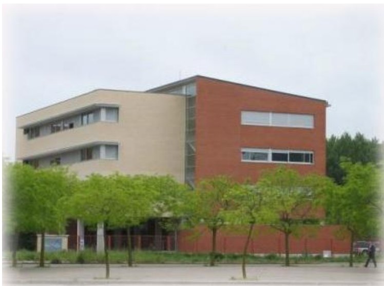
Figura 1.- CIFP Juan de Colonia

Sus orígenes se remontan a la década de los 40, constituida como Escuela del trabajo con sede en la C/ Madrid, después pasó a denominarse “Escuela de Maestría Industrial”. En la década de los 60 con la implantación de las nuevas enseñanzas de Formación Profesional (FP1 y FP2) pasó a denominarse Instituto Politécnico. Con la implantación de la LOGSE, en 1992 fue convertido en Instituto de Ecuación Secundaria. En el año 2003, por segregación de las familias de servicios del IES Simón de Colonia, se creó el CEFPI Juan de Colonia. Por último, por Acuerdo 198/2007, de 26 de julio, de la Junta de Castilla y León, se transforma en Centro Integrado, siendo su actual nombre: Centro Integrado de FP “Juan de Colonia”